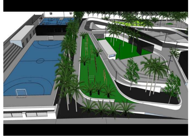
Imágenes proyecto Ecoparque Tías.