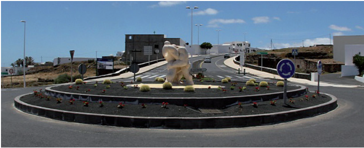
Embellecimiento Rotonda Avenida Central-Calle San Blas.