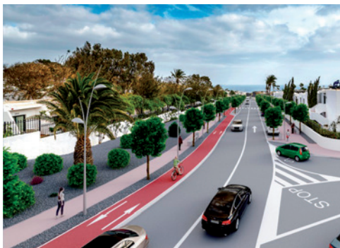
Transformación calle Reina Sofía, Puerto del Carmen.