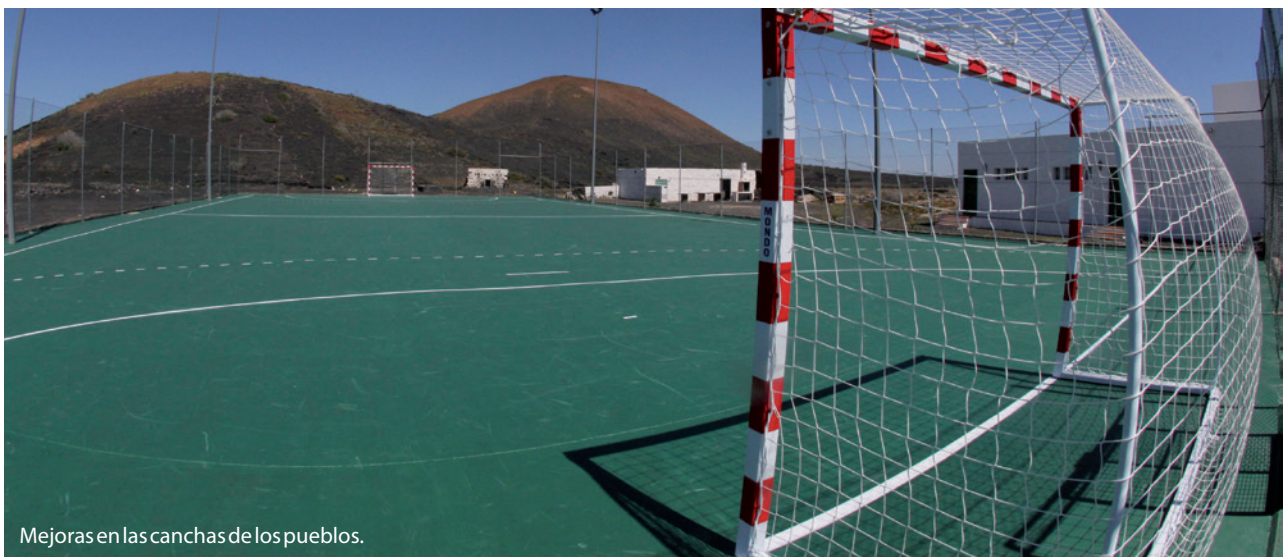
Mejoras en las canchas de los pueblos.

Ha sido en esta nueva etapa de gestión en el Ayuntamiento de Tías cuando los clubes deportivos y las Escuelas Municipales Deportivas han contado con más ayudas y los clubes han cobrado o tiempo y formalas ayudas deportivas. Más de 1300 niños y niñas, y jóvenes adolescentes practican deporte en las instalaciones municipales y con las Escuelas Deportivas de Tías. En estos años muchos de los clubes han logrado nuevos títulos y premios para el éxito del deporte base del municipio.