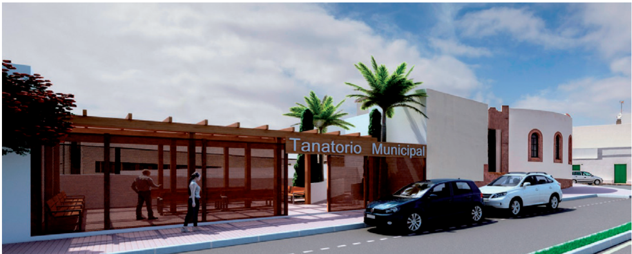
El Tanatorio será remodelado y ampliado con una inversión próxima a los 400.000 euros.