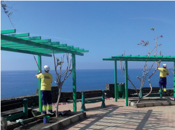
Actuaciones de mantenimiento en el litoral.