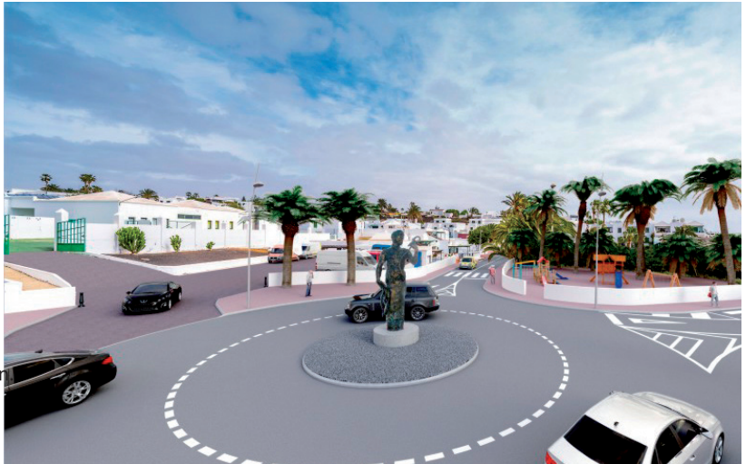
Plan de Embellecimiento: Escultura Homenaje al Marinero

“ Plan de inversión en infraestructura 2014 - 2016