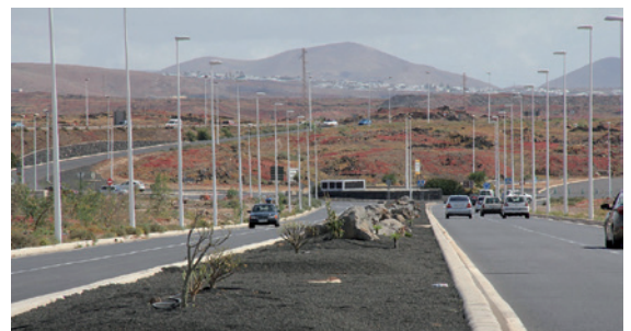
Ajardinamiento Rambla Islas Canarias.