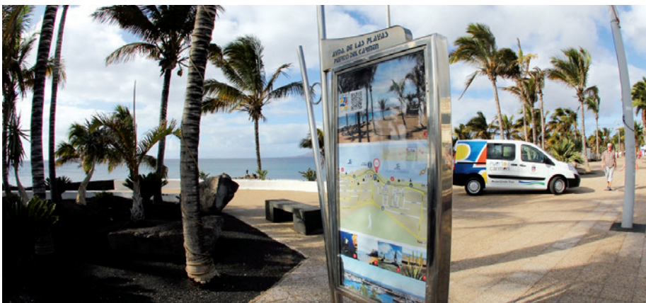
Mejora de la imagen de Puerto del Carmen con nuevos paneles informativos y nuevo coche de turismo.