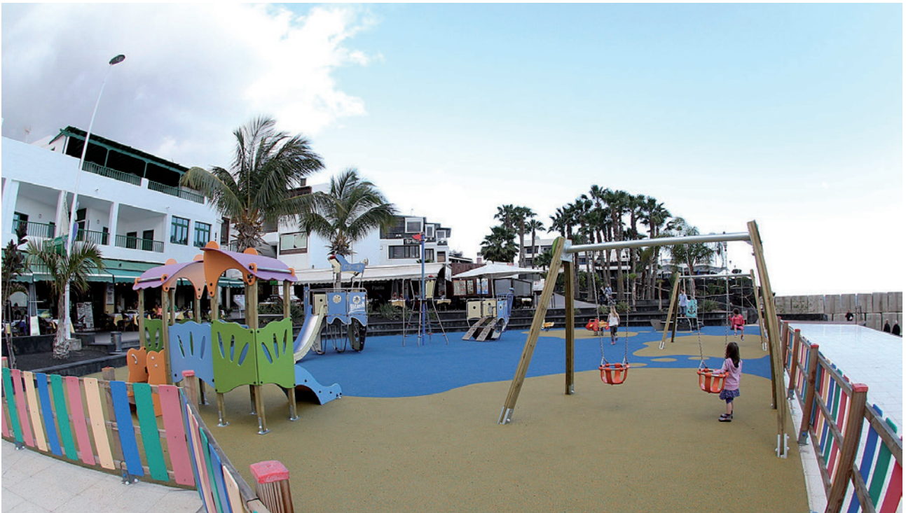
Nuevos parques infantiles en La Tiñosa

E n esta etapa de buen Gobierno en el Ayuntamiento de Tías se han modernizado todos los parques infantiles del municipio. Se han instalado nuevas atracciones más seguras para los más pequeños, homologadas a la normativa de la Unión Europea. Todos los suelos de los nuevos parques están cubiertos con un pavimento especial que amortigua los posibles daños antes de las caídas de los niños. En los pueblos del municipio las atracciones se han montado sobre césped artificial. Tías se convierte en el primer municipio de Lanzarote en contar con parques homologados y seguros. El grupo Popular ha trabajado para tener un municipio mejor para los más pequeños.