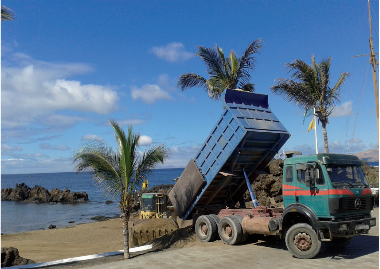
Reposición de arena en Playa Chica.

La gestión en materia de playas ha destacado de manera especial en esta etapa con el Partido Popular frente a los 28 años atrás del Psoe. Se ha reforzado el cuidado de nuestras playas, logrando que todas tengan banderas azules además de poner en marcha varias mejoras en cada una de las playas. Desde reposición de arena, plantación de palmeras y embellecimiento de sus accesos, eliminación de barreras arquitectónicas, instalación de nuevas duchas o las reformas de los baños públicos en la Playa Grande de Puerto del Carmen. Por las playas del litoral de Tías pasan cada año más de un millón de visitantes. Ahora cuentan con más y mejores servicios, más accesibles y sin barreras e instalaciones adaptadas para personas con movilidad reducida. Las playas de Puerto del Carmen invitan a disfrutarlas, están más cuidadas y limpias para ti.