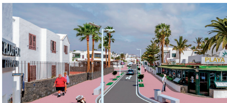
Transformación calle Pedro Barba Puerto del Carmen.