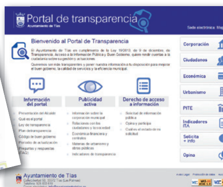
Nueva página web con servicio de trámites online. Creación del portal de transparencia.