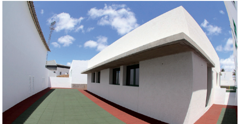
Nuevas aulas en el Colegio Alcalde Rafael Cedrés (Tías)

El equipo del Partido Popular ha dado respuesta a los padres y madres de alumnos del Colegio Mácher La Asomada. Un colegio que carecía de aparcamiento y zonas de acceso seguras. En esta etapa se ha construido el parking y el comedor, solicitados por la realidad gracias a nuestra gestión junto con el resto de la comunidad educativa.