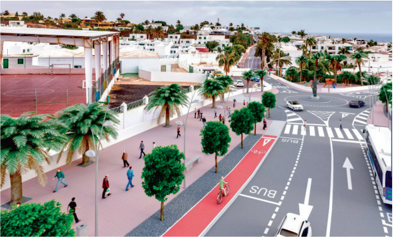
Transformación calle Reina Sofía, Puerto del Carmen.