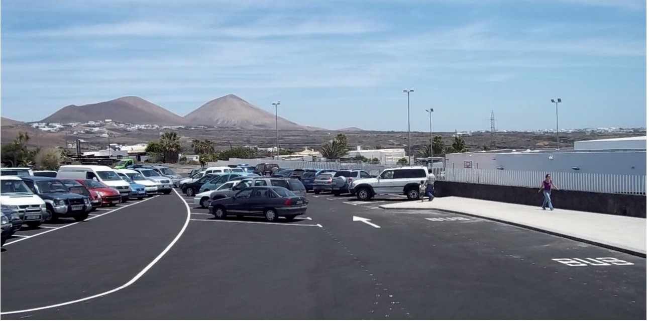
Nuevo aparcamiento en el Colegio Público La Asomada-Mácher