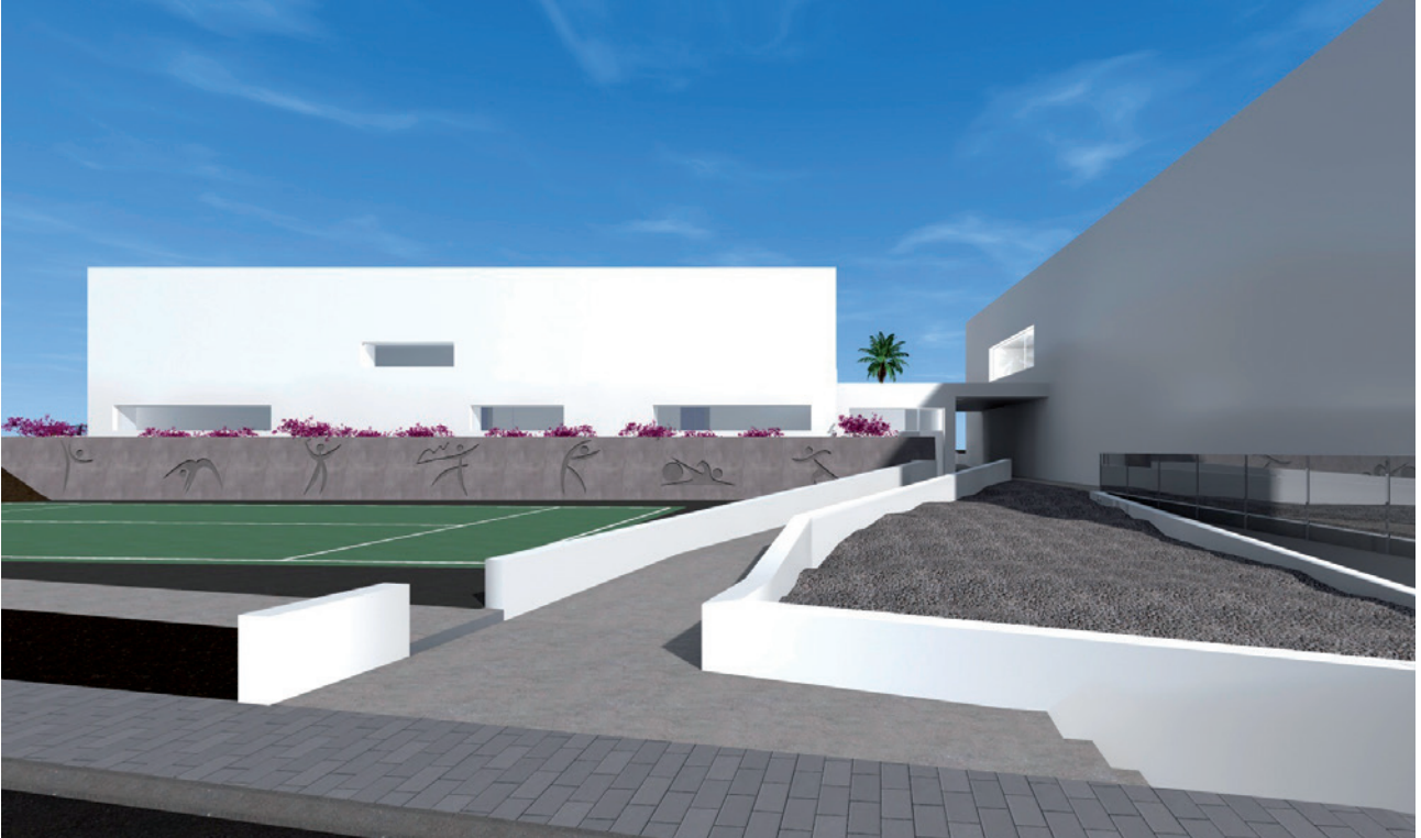
Mejoras en instalaciones deportivas.