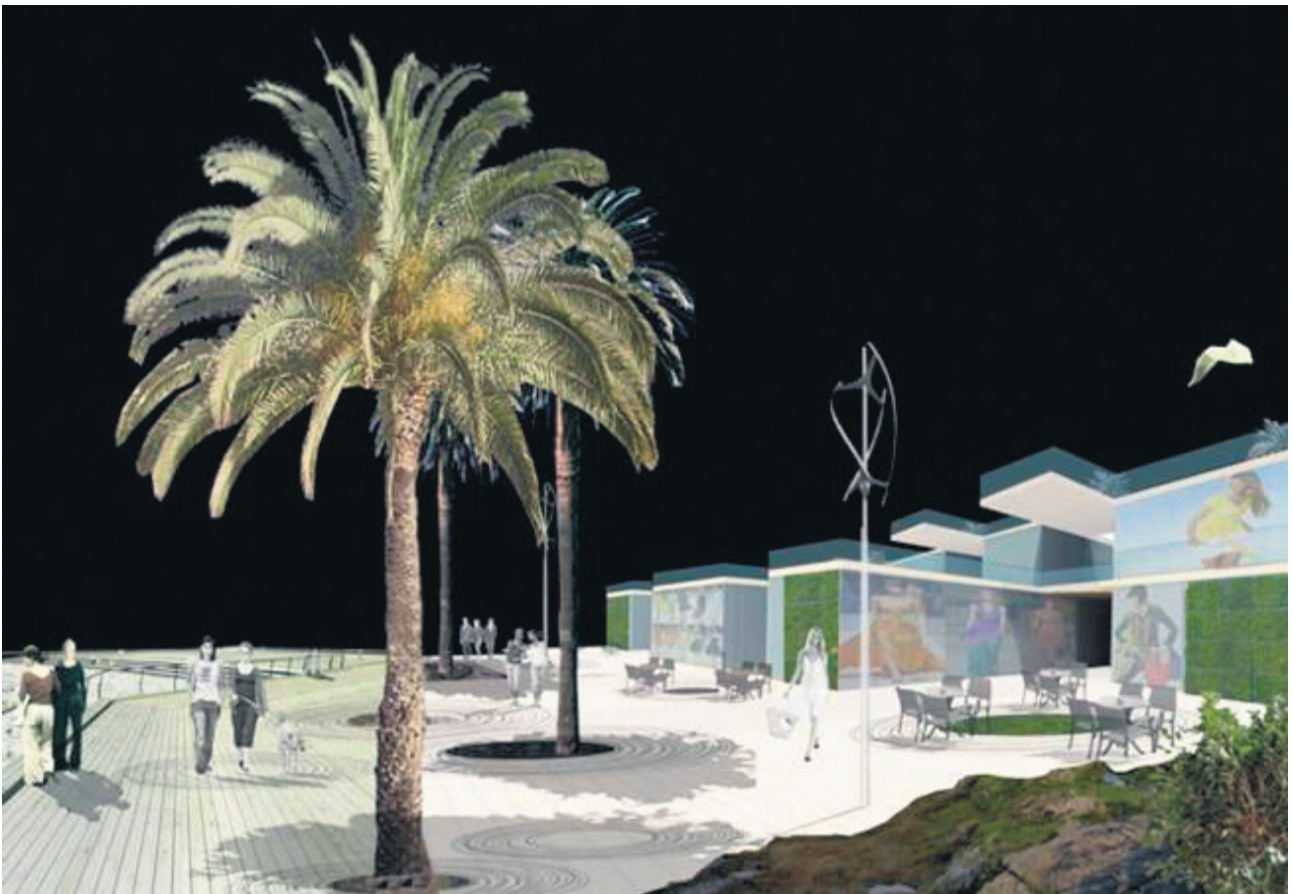
Recreación de una de las nuevas zonas públicas que está en obra en Puerto del Carmen con el Plan de Modernización.