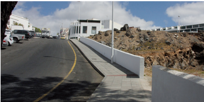
Dotación de acera calle Roque Nublo.