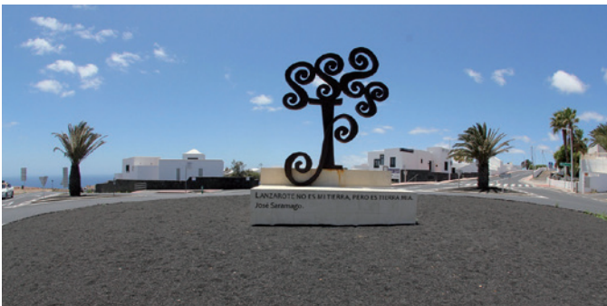
Embellacimiento Glorieta José Saramago.