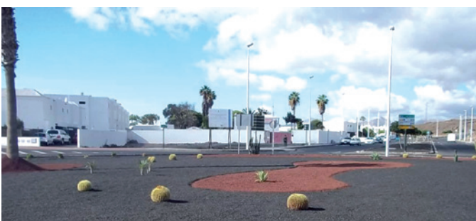
Embellacimiento Rotonda calle Anzuelo.