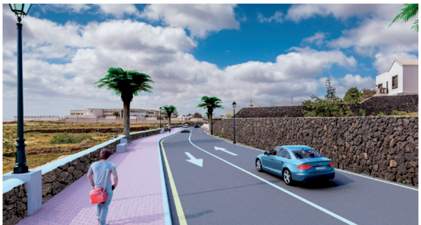
Acera de acceso al IES de Tías Camino de los Lirios.