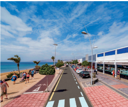
Reasfalto avenida de Las Playas, Puerto del Carmen