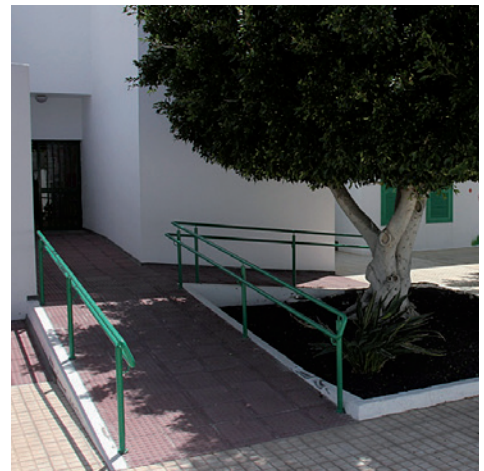
Nueva rampa de acceso en el Colegio Concepción Rodríguez Artilles (Puerto del Carmen)

Las Ampas de cada colegio han contado con el apoyo y colaboración del Ayuntamiento para sus actividades extraescolares.