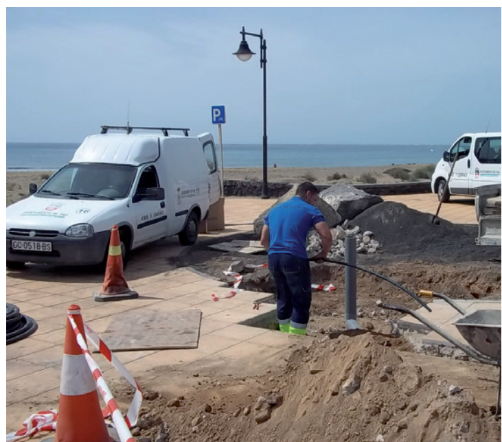
Se han instalados 8 lavapies en las playas de Puerto del Carmen

La gestión en materia de playas ha destacado de manera especial en esta etapa con el Partido Popular frente a los 28 años atrás del Psoe. Se ha reforzado el cuidado de nuestras playas, logrando que todas tengan banderas azules además de poner en marcha varias mejoras en cada una de las playas. Desde reposición de arena, plantación de palmeras y embellecimiento de sus accesos, eliminación de barreras arquitectónicas, instalación de nuevas duchas o las reformas de los baños públicos en la Playa Grande de Puerto del Carmen. Por las playas del litoral de Tías pasan cada año más de un millón de visitantes. Ahora cuentan con más y mejores servicios, más accesibles y sin barreras e instalaciones adaptadas para personas con movilidad reducida. Las playas de Puerto del Carmen invitan a disfrutarlas, están más cuidadas y limpias para ti.