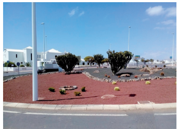
Embellacimiento Rotonda calle Finlandia.