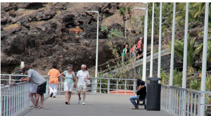
Dotación de mobiliario urbano, paseo en el puerto.