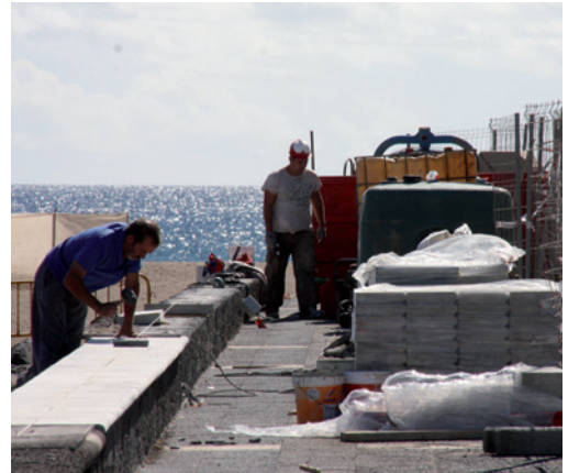
Muro de Playa Pocillos.