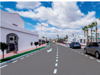
Transformación calle Princesa lco. Puerto del Carmen.

“ Plan de inversión en infraestructura 2014 - 2016