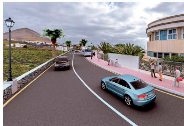
Mejora en los accesos al IES de Tías.

Junto al cambio al interior de Puerto del Carmen, donde se rán asfaltadas más de 70 calles, todos los pueblos del municipio