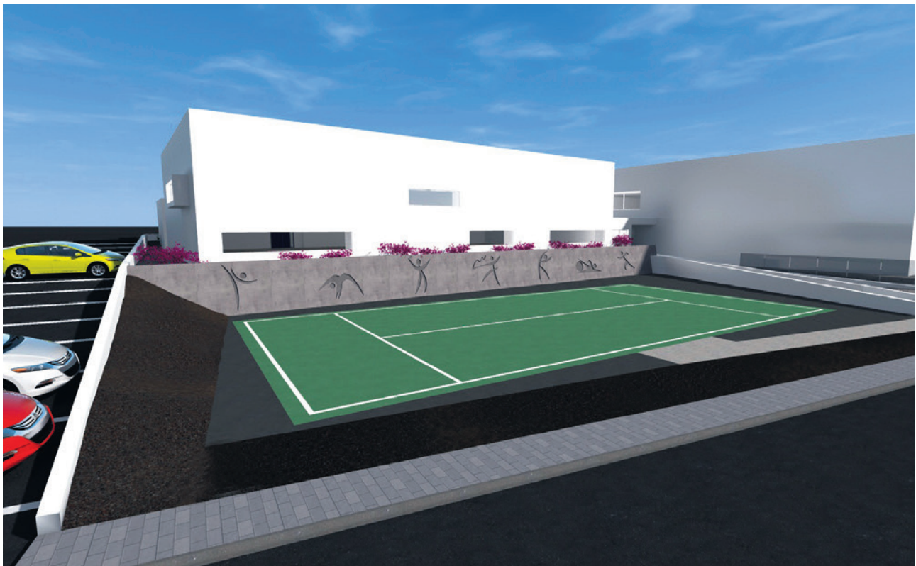
Imagen de las nuevas instalaciones en Tías.

El Plan de Nuevas Instalaciones puesto en marcha bajo la etapa del PP, ha logrado que todos los vecinos y vecinas, especialmente los jóvenes deportistas, cuenten con nuevas y modernas instalaciones.