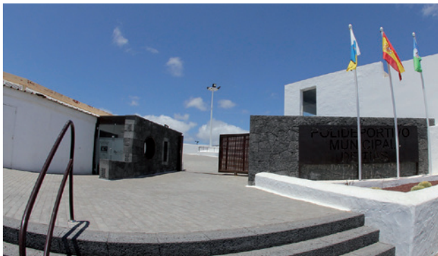
Entrada al Polideportivo municipal.