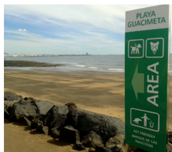
Playa para perros.