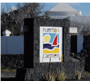
Rehabilitación de monolitos en la zona turística.