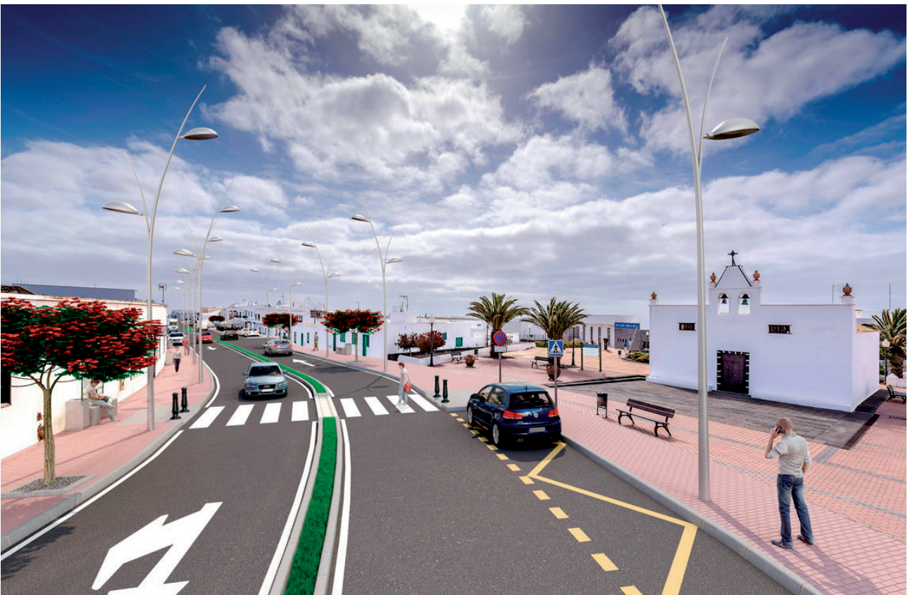
Transformación Avenida Central de Tías, Alcalde Florencio Suárez.