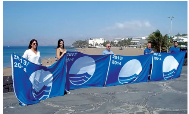
Tías, único municipio de Lanzarote que cuenta con banderas azules en todas sus playas.

Las Playas de Puerto del Carmen cuentan de manera permanente no solo con la presencia de la Policía de Playas, sino con 20 efectivos del Servicio de Vigilancia y Socorrismo creados en esta etapa de Gobierno de los Populares en Tías.