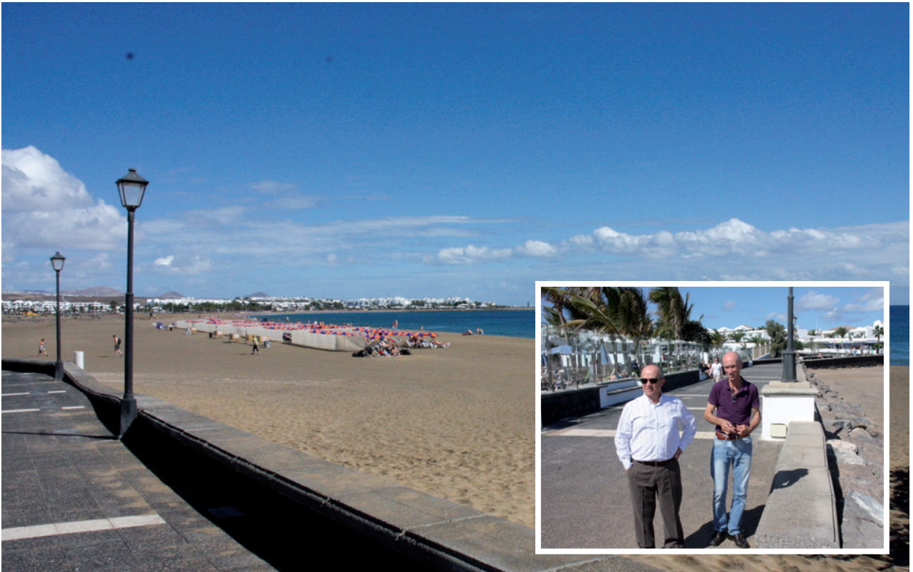
Actuación en el muro de la playa de Los Pocillos.

Cada día, todas las semanas, en estos últimos 4 años se han estado ejecutando muchas obras en cada rincón del municipio. Obras de eliminación de barreras arquitectónicas, construcciones y reparaciones de muros, mejora de las aceras, mantenimiento del mobiliario urbano y de la vía pública, ajardinamiento, etc. En nuestro grupo de Gobierno, los Populares de Tías, nos hemos caracterizado por hacer con poco mucho. Con tus ojos has podido ver en tu calle o pueblo muchas pequeñas obras, todas mejoran tu vida.