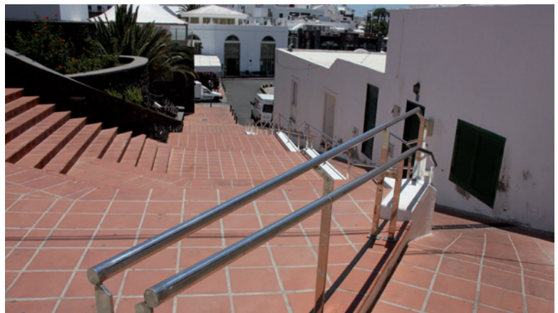
Barandilla en el Centro Cívico Fondateiro

Cada día, todas las semanas, en estos últimos 4 años se han estado ejecutando muchas obras en cada rincón del municipio. Obras de eliminación de barreras arquitectónicas, construcciones y reparaciones de muros, mejora de las aceras, mantenimiento del mobiliario urbano y de la vía pública, ajardinamiento, etc. En nuestro grupo de Gobierno, los Populares de Tías, nos hemos caracterizado por hacer con poco mucho. Con tus ojos has podido ver en tu calle o pueblo muchas pequeñas obras, todas mejoran tu vida.