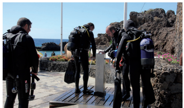
Nuevo parque acuático y nuevos lavapies en Plas playas.