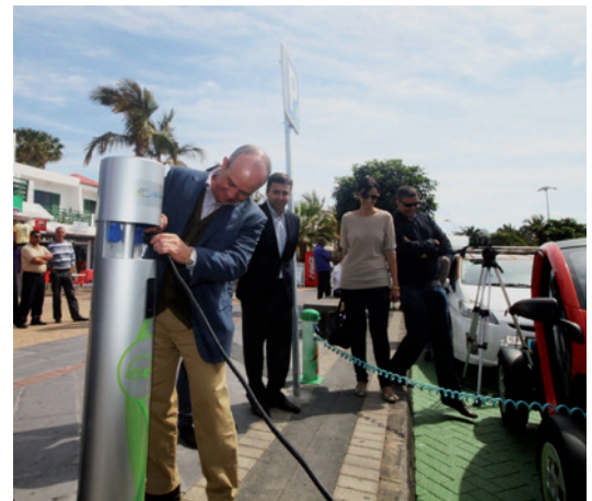
Instalación de puntos de recarga para vehículos eléctricos