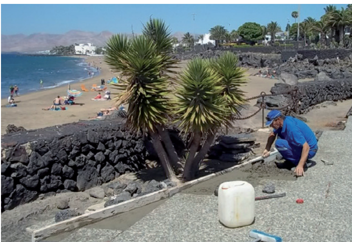
Actuaciones de mantenimiento en la avenida de Las Playas.