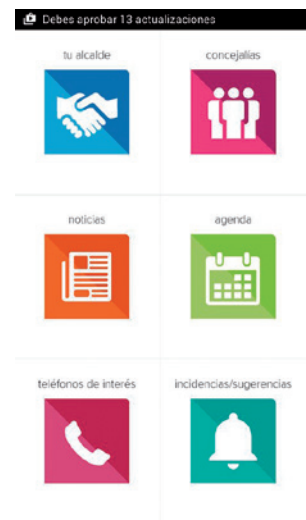
Nueva APP con información municipal que permite también envío de incidencias.