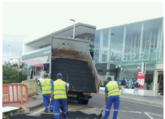
Trabajos de mantenimiento de reasfalto.