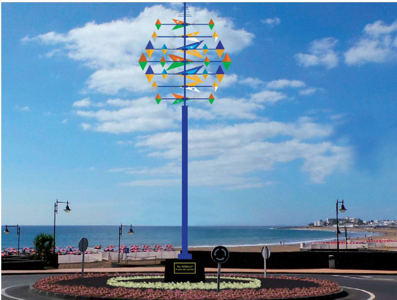
Juguete del Viento "El Róbalo" de César Manrique.