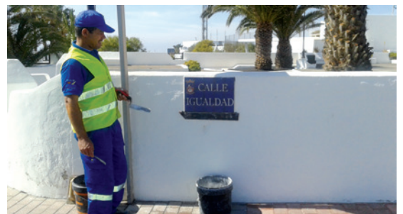
Nuevo Plan de señalización de calles.